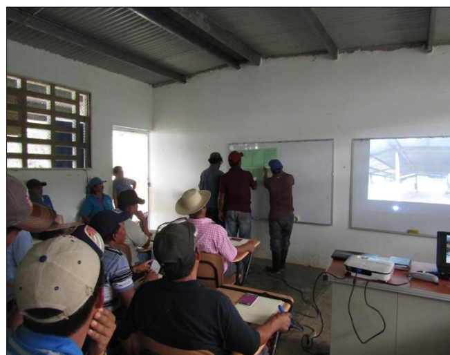
Figuras 3 y 4- Trabajo en grupos conformados por comunidades cercanas entre sí en donde analizan las debilidades y fortalezas en cada una de esas organizaciones que atienden el tema del abastecimiento de agua. El trabajo de grupo es asistido por personal del MINSA y los equipos de ACP, PNUD y Prysma Social Consultores S.A.