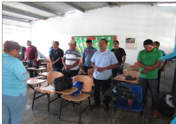
Figuras 2 y 3 - Introducción del tema sobre los ejes temáticos del taller e invocación religiosa por parte de un miembro de la comunidad.