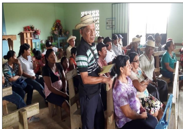
Figuras 17 y 18- Invocación religiosa por parte de un residente de la comunidad sede y a la derecha un miembro de la comunidad de Las Canoas expone los resultados de su grupo de trabajo que analizaron las fortalezas y debilidades de sus respectivos sistemas de abastecimiento de agua con que cuentan actualmente.