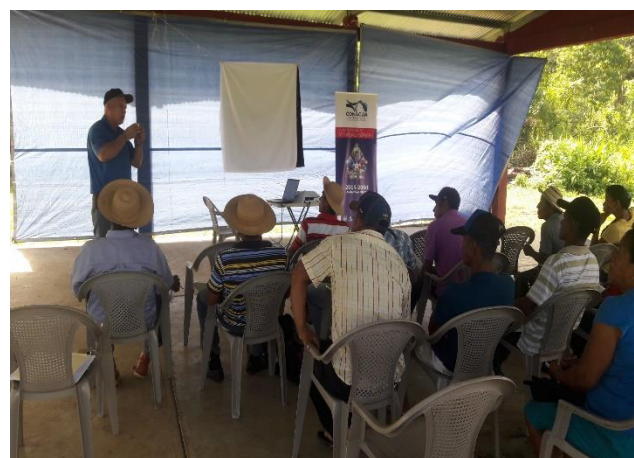
Figuras 7 y 8- Técnico de saneamiento ambiental del Centro de Salud del Espino (Regional de Salud de Panamá Oeste), explicando como se realiza la clorinación en los acueductos rurales.